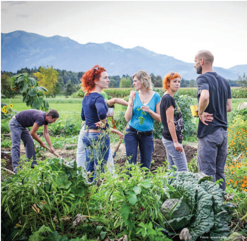
Gartenunser in Sulz: „Es ist an der Zeit, wieder etwas über den Nahrungsmittelanbau zu lernen.“